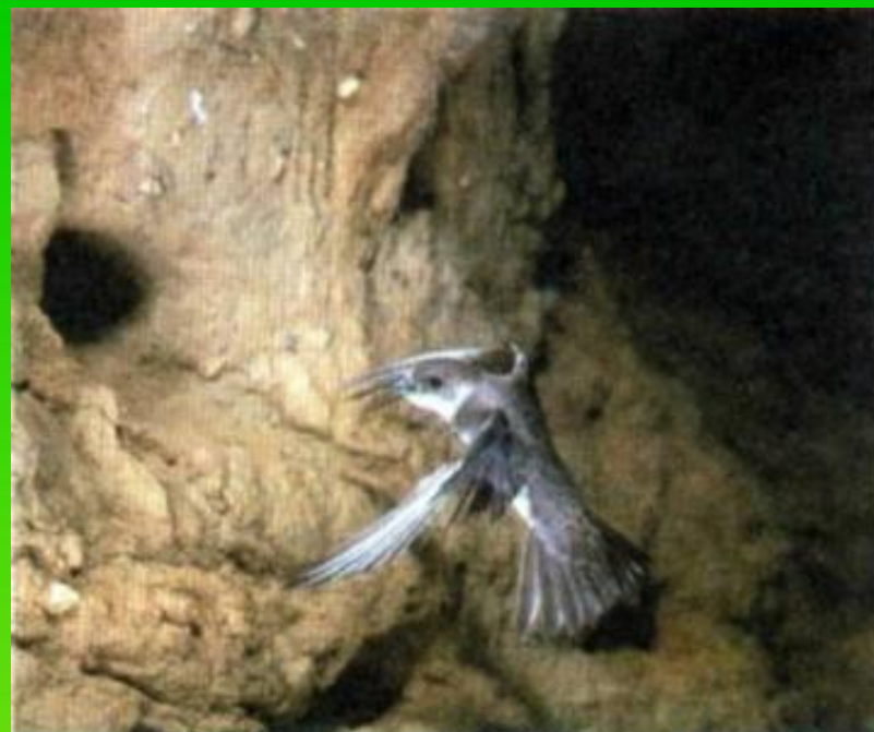
Гнездо береговой ласточки

Гнезда ласточек очень интересно построены. Особенно хорошо строит гнездо городская ласточка. Она так искусно лепит из глины, смоченной слюной, шарообразное гнездышко, что оно может оставаться целым в течение нескольких лет; прочность его очень велика.